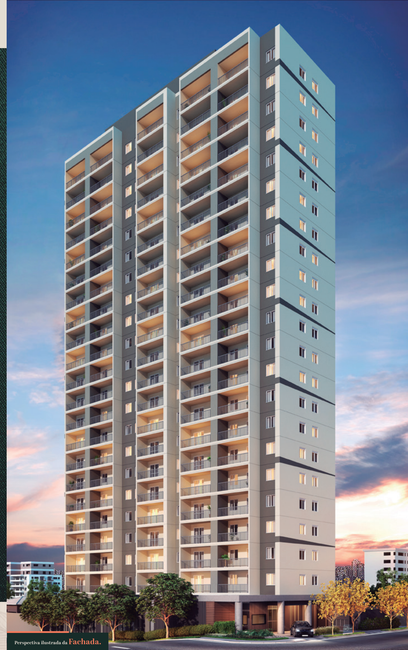
Perspectiva ilustrada da Fachada.