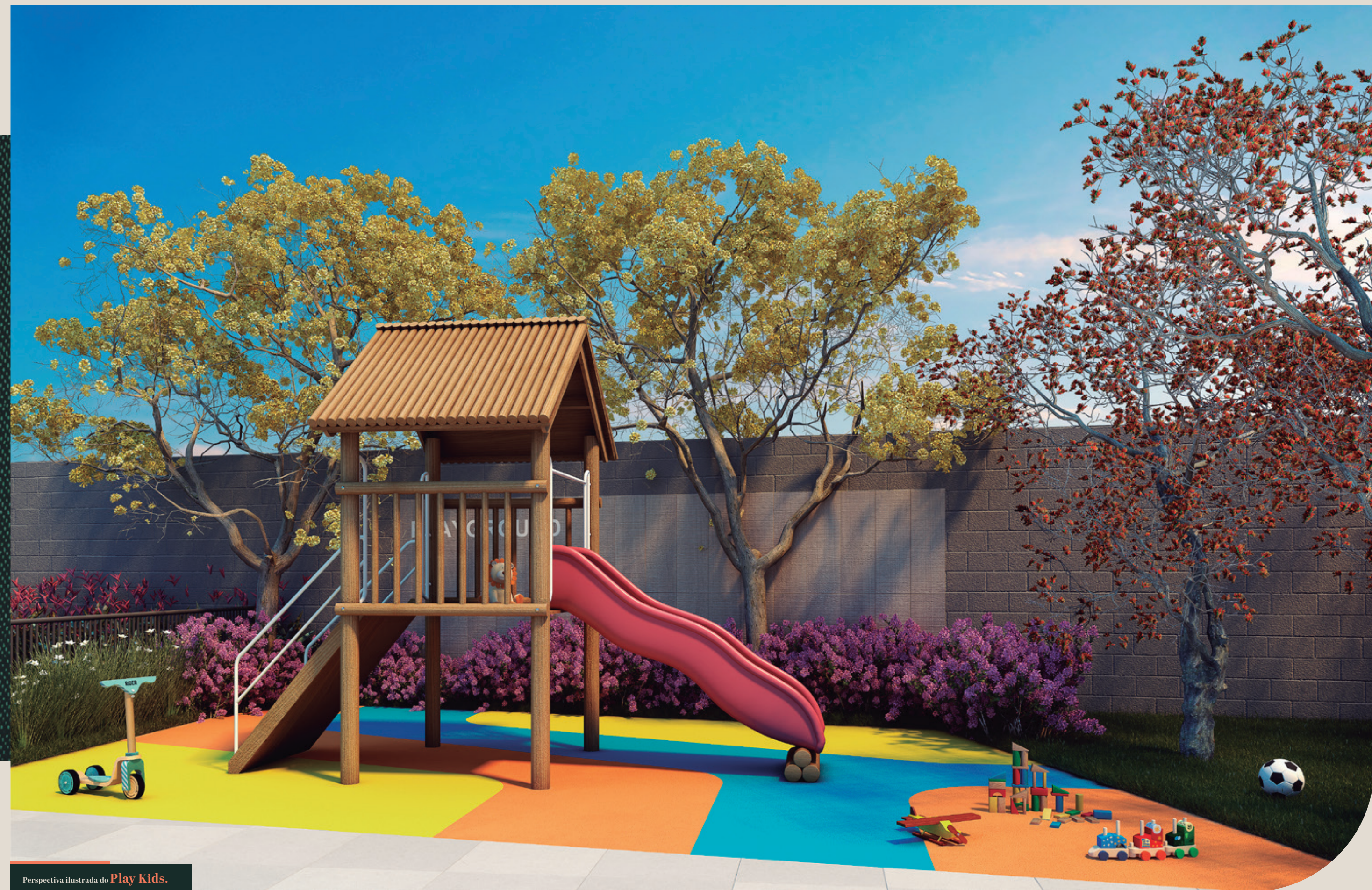
Perspectiva ilustrada do Play Kids.