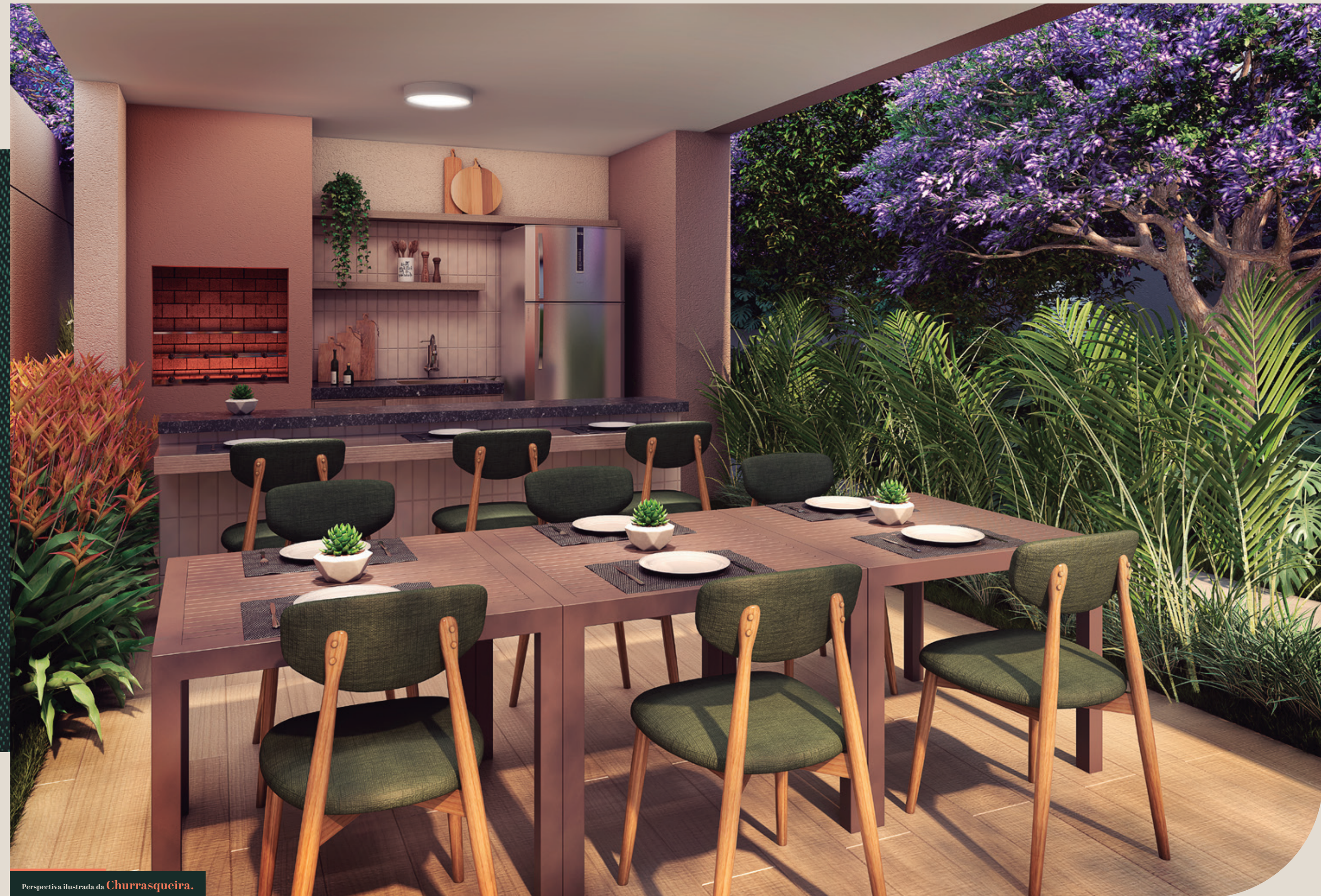
Perspectiva ilustrada da Churrasqueira.