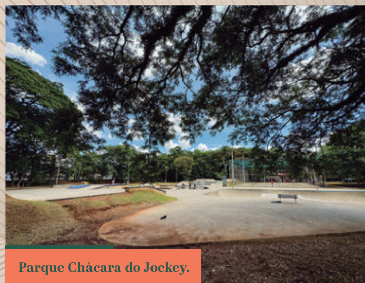
Parque Chácara do Jockey.