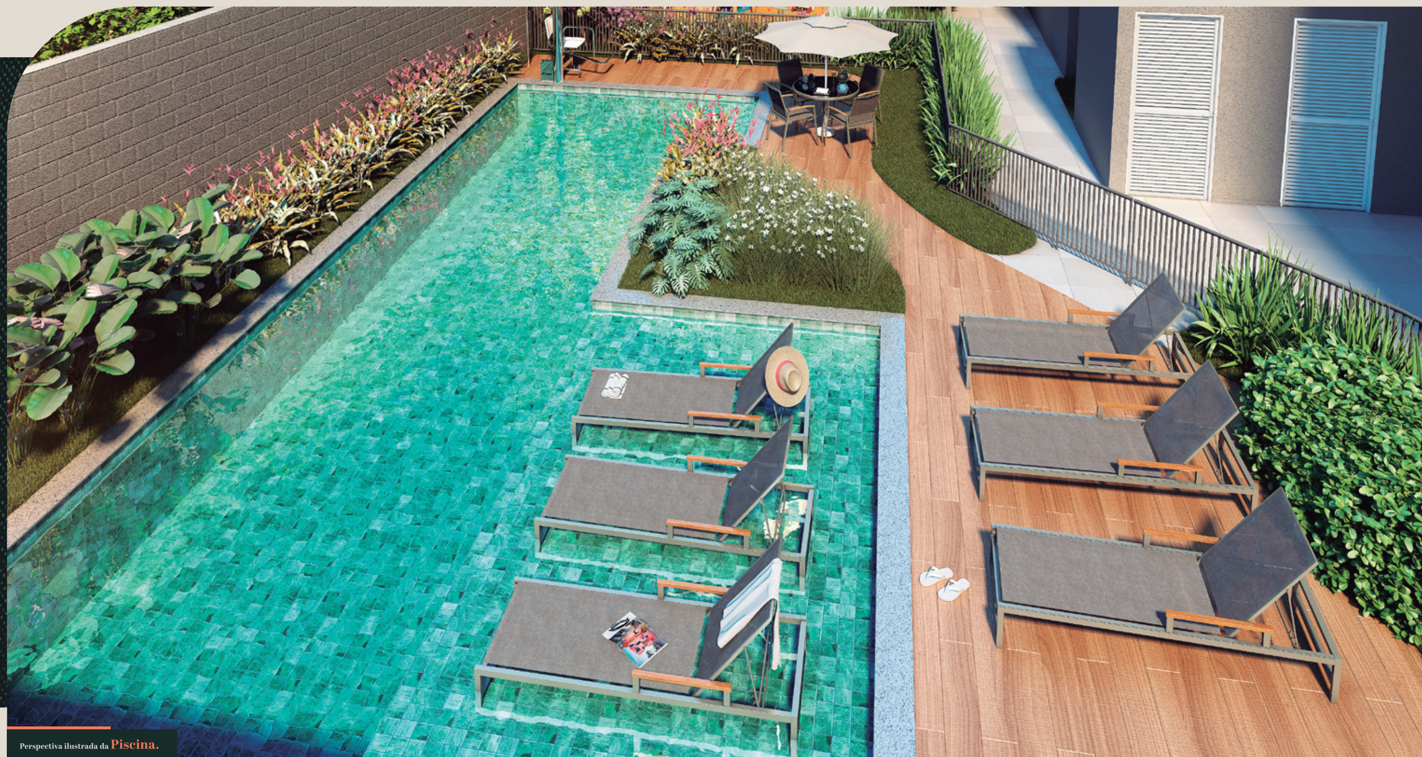
Perspectiva ilustrada da Piscina.