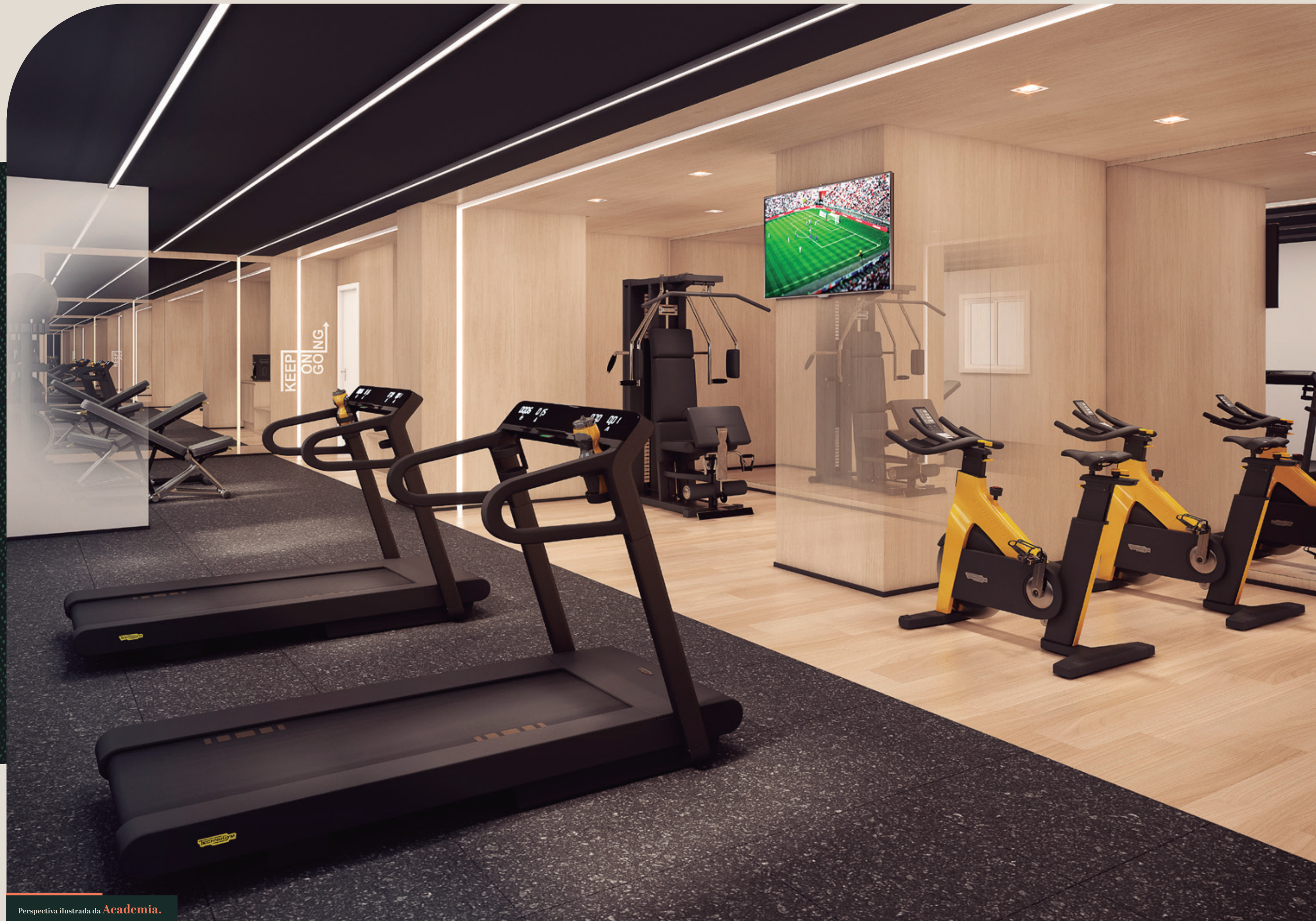
Perspectiva ilustrada da Academia .