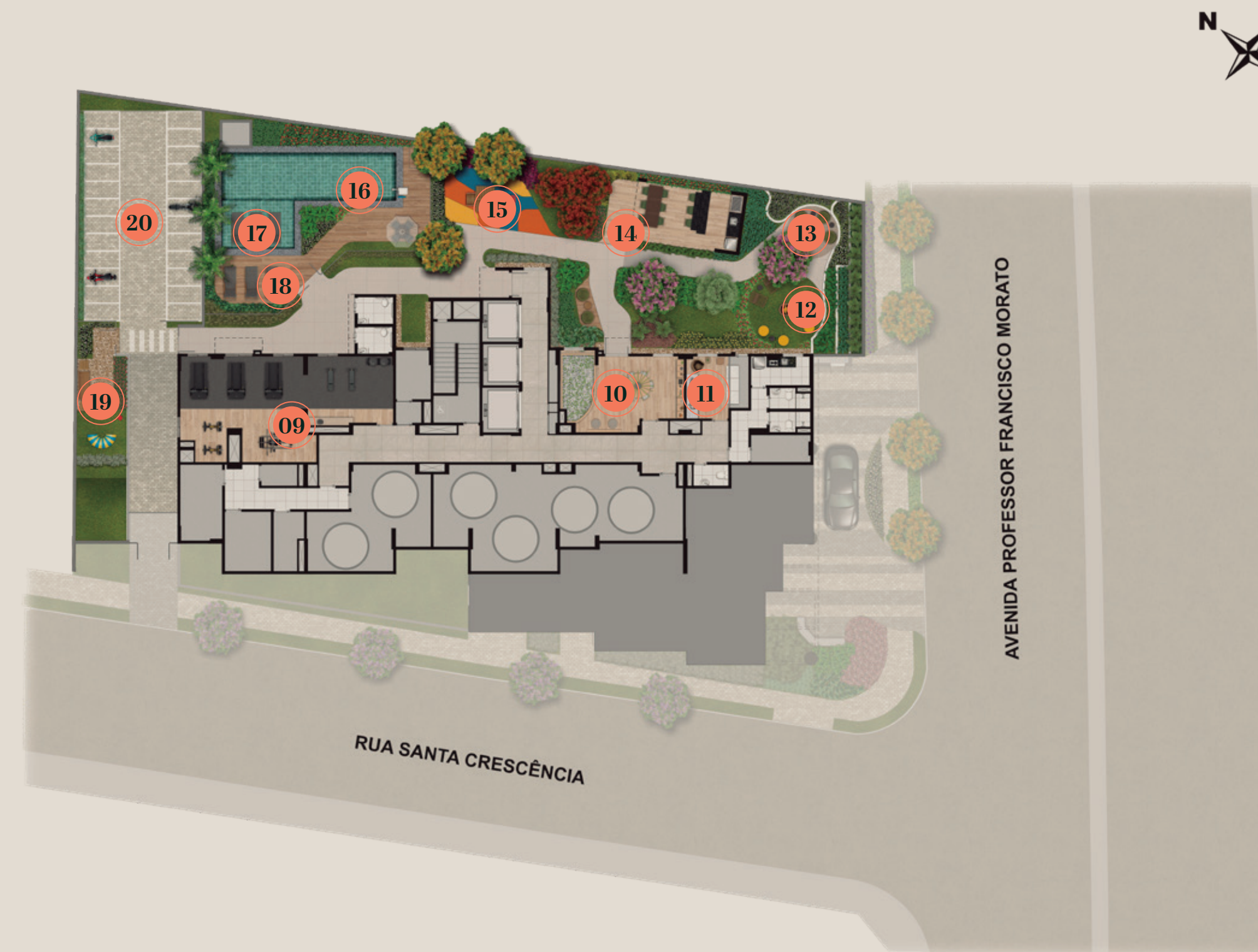
Ilustração da Implantação