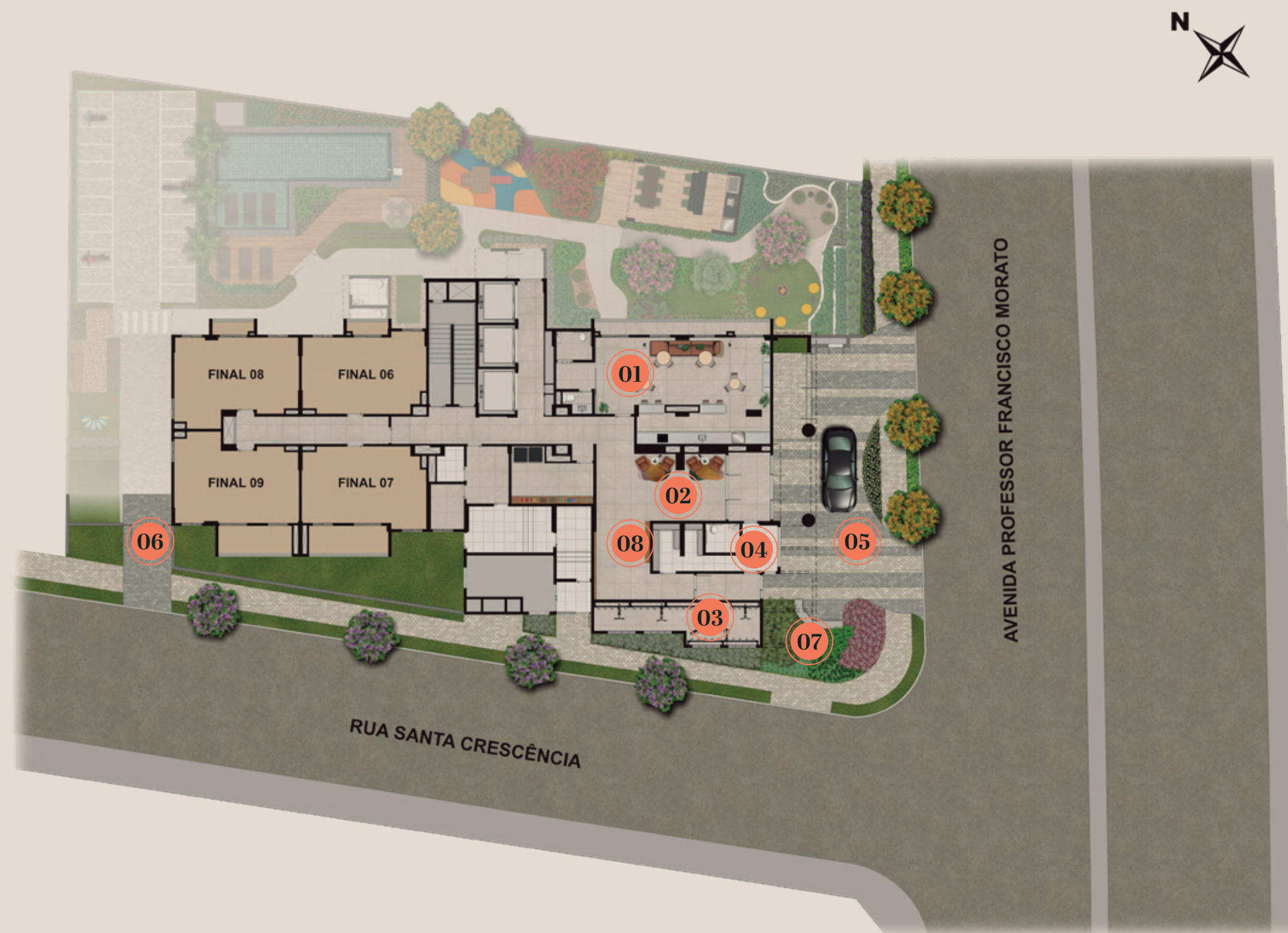
Ilustração da Implantação