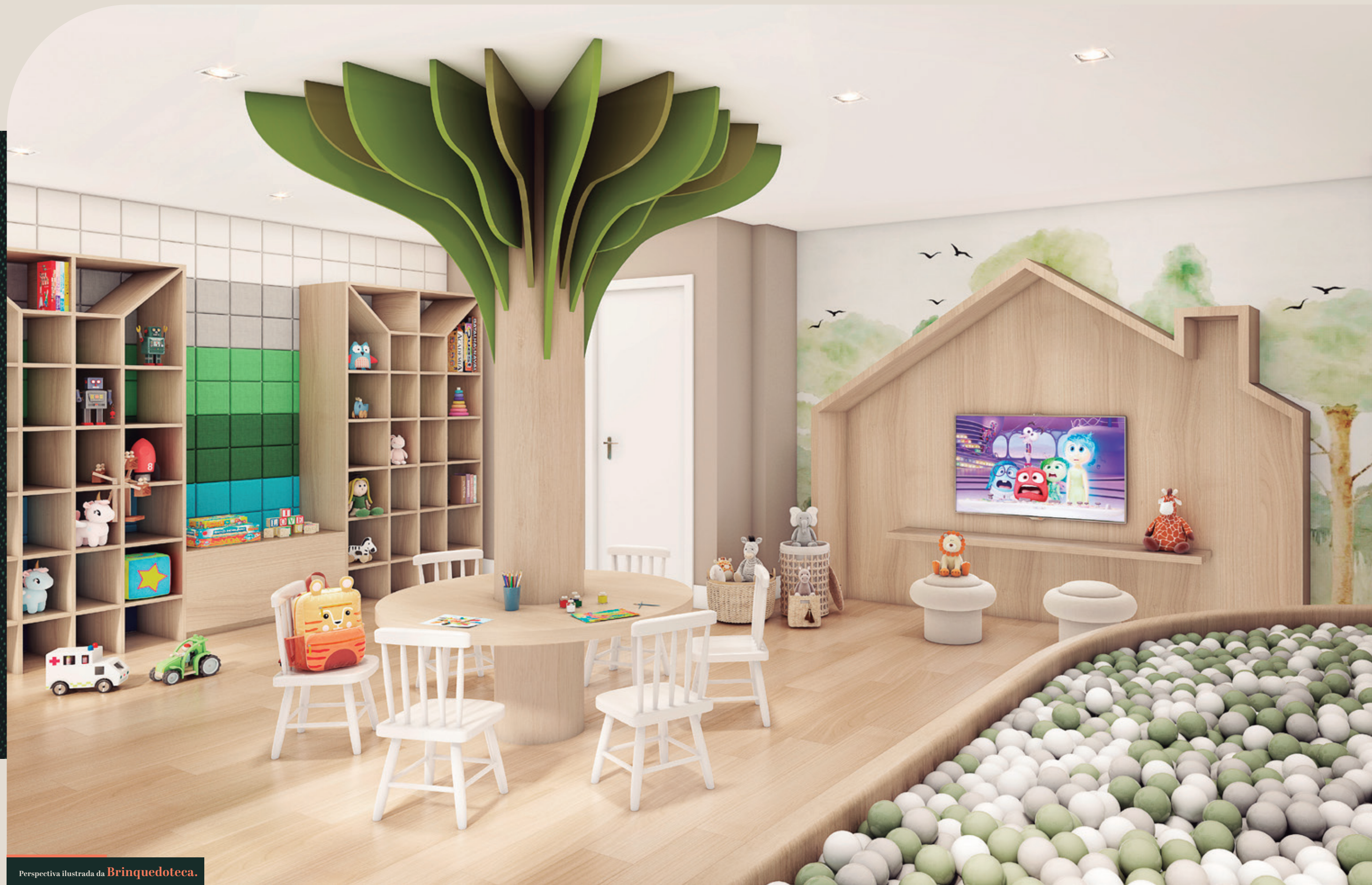
Perspectiva ilustrada da Brinquedoteca.