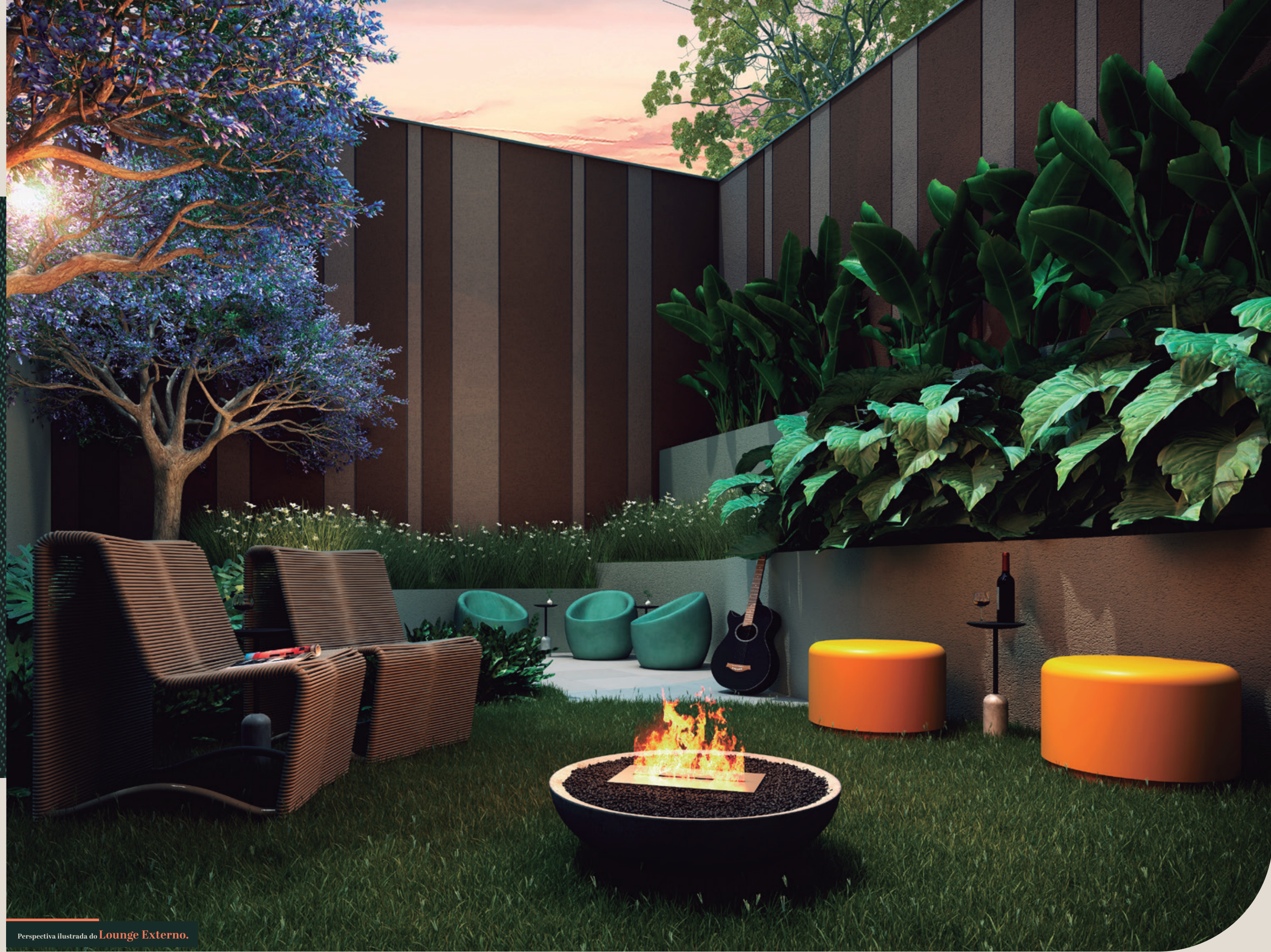
Perspectiva ilustrada do Lounge Externo.