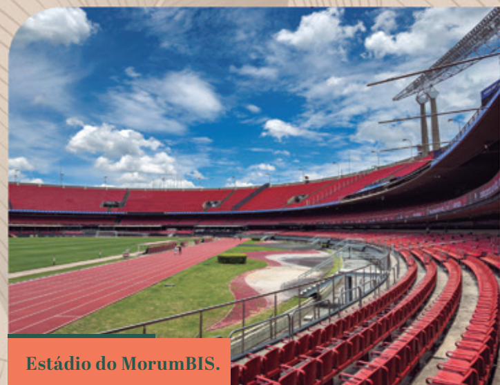
Estádio do MorumbiS.