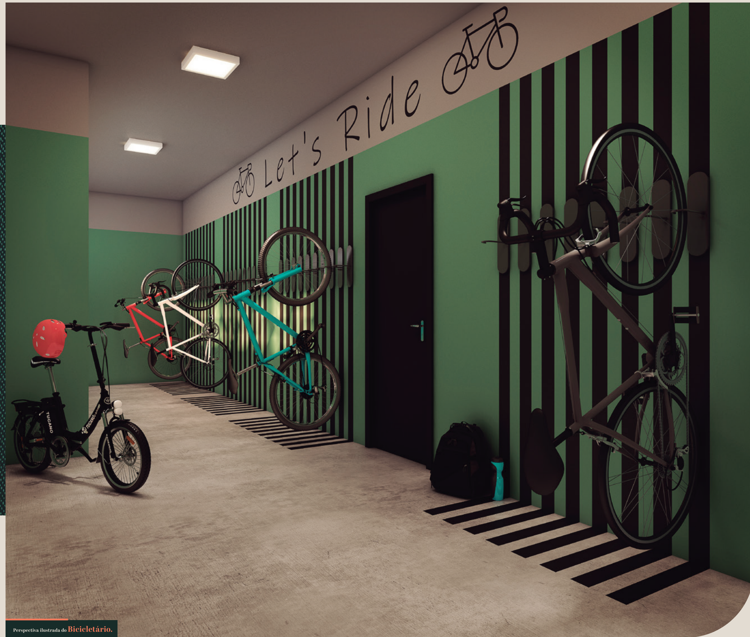
Perspectiva ilustrada do Bicicletário .