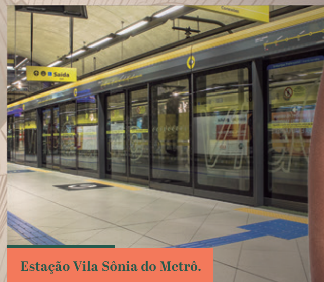
Estação Vila Sônia do Metrô.