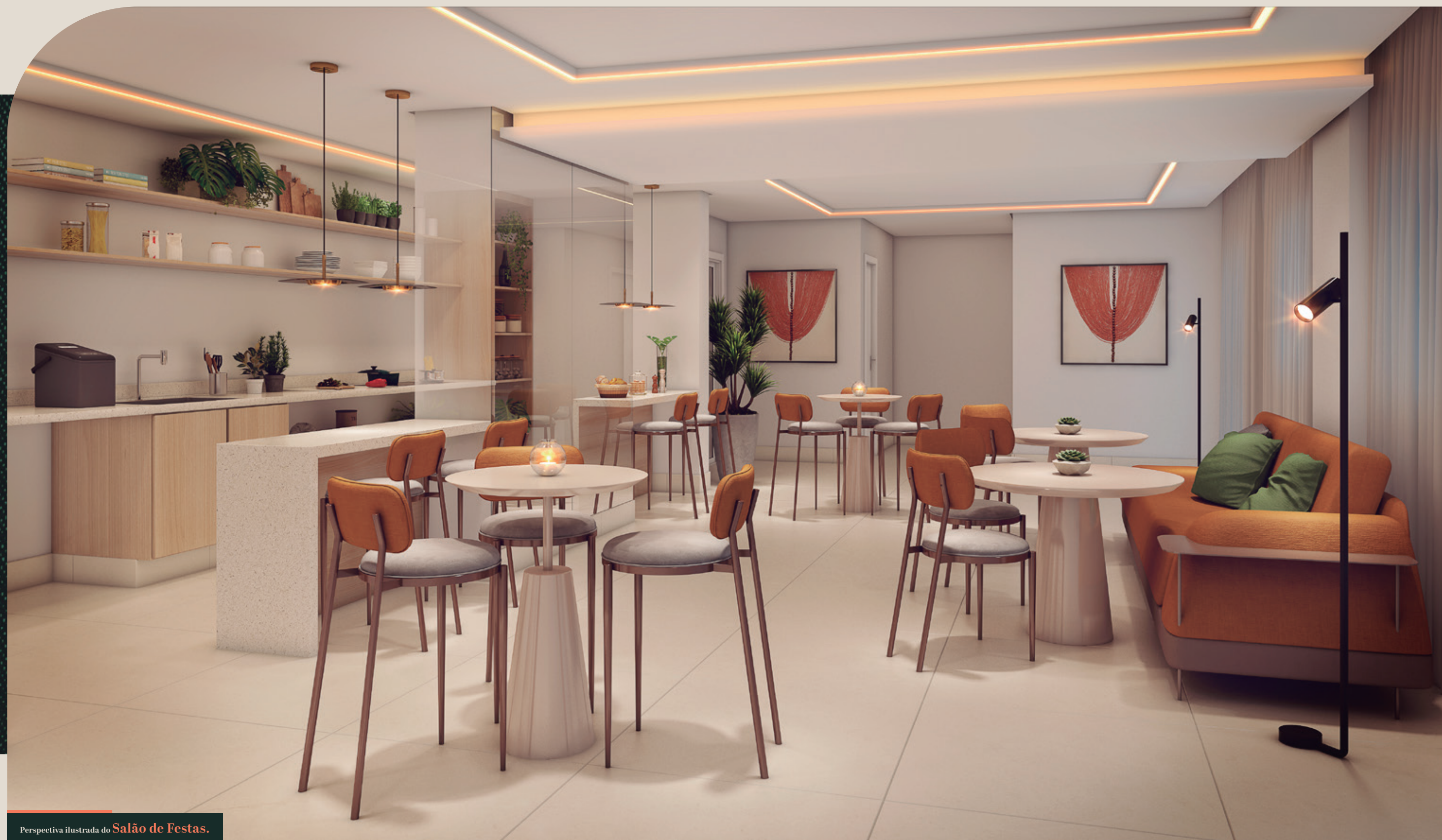
Perspectiva ilustrada do Salão de Festas.